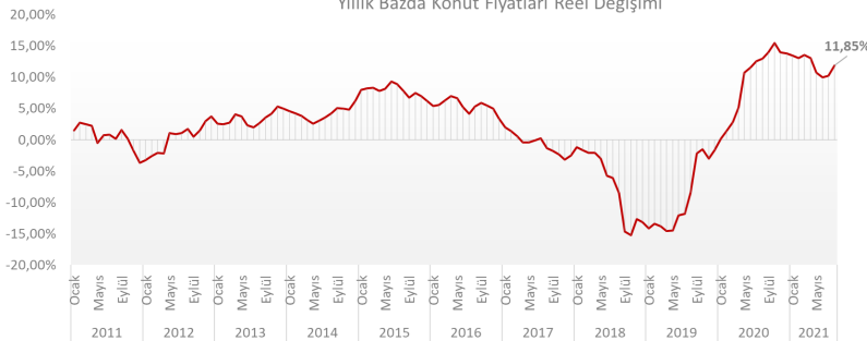
Yıllık Bazda Konut Fiyatları Reel Değişimi