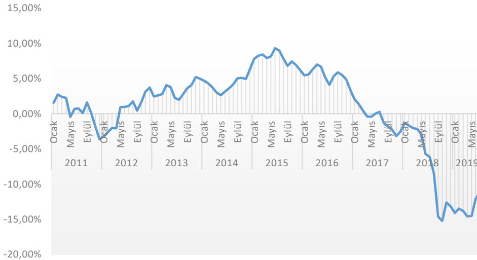
Konut Fiyatlarının Reel Değişimi